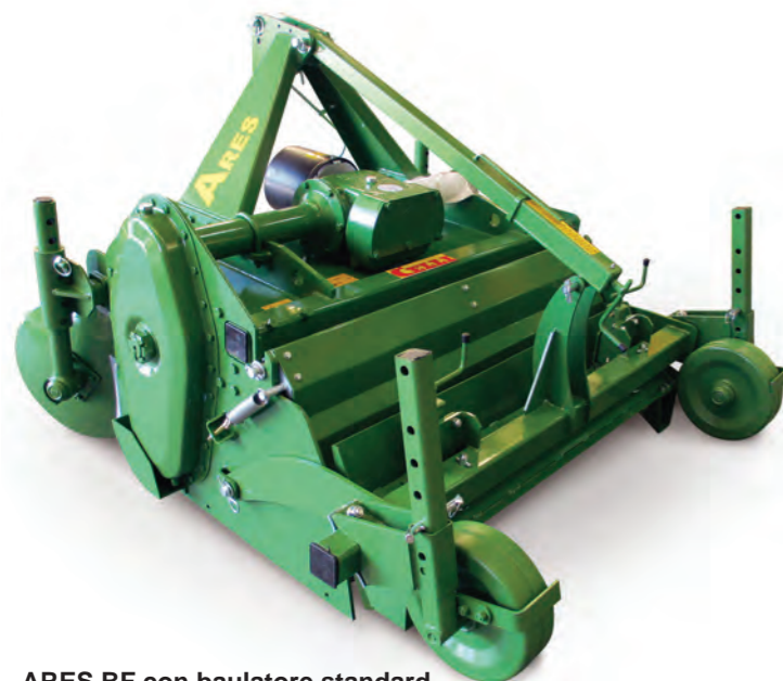
ARES BF con baulatore standard ARES BF with standard bed former ARES BF avec butteuse standard ARES BF mit Standard Beetformer