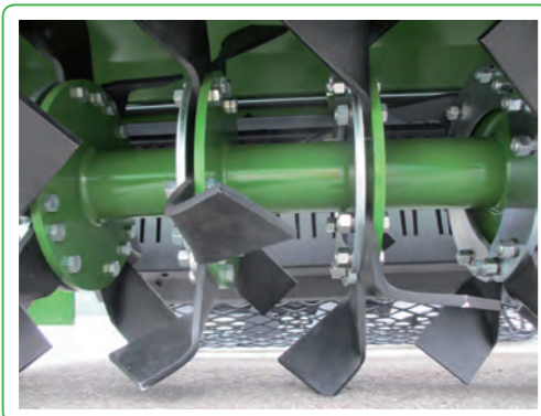
Zappe interrasassi 6 per flangia con controflangia Stone burrier blades 6 each flange with counterflange Lames enfouisseur 6 pour bride avec contre-bride Messer Umkehrfräse 6 pro Messerträger mit Gegenmesserträger

• Dati descrizioni ed illustrazioni sono forniti a titolo indicativo e non impegnativo. • All data subject to change, without any prior notice. • Données techniques, descriptions et illustrations sont fournies à titre d'indication. • Angaben, Beschreibungen und Abbildungen sind freibleibend und unverbindlich.