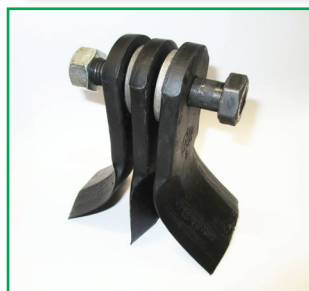
OPTIONAL 3 coltelli (2 a Y + 1 diritto) Y shaped blades with straight blade 2 Couteaux à Y + 1 droit 2 Y-Messer und 1 gerades Messer