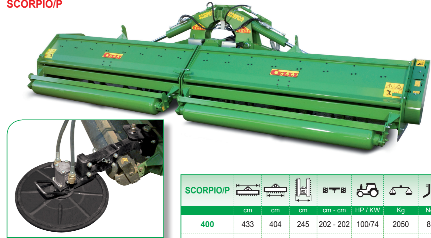
Kit disco con filo tagliaerba Central hydraulic mover Broyeur hydraulique central Fadenschneide